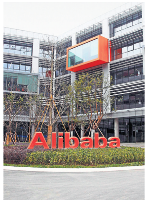
Alibaba's net profit rose 51% year-on-year.

Alibaba's net profit rose 51% year-on-year. Competition has increased recently from rivals known for offering low-cost products, such as PDD Holdings Pinduoduo and ByteDance's Douyin, the Chinese version of TikTok, both of which pose major challenges to Alibaba.